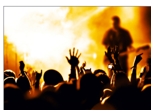
Hôtels, salles de conférence, lieux d'événement