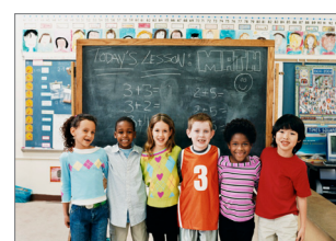
Éducation: écoles, universités